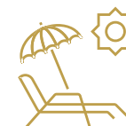
OGÓLNODOSTĘPNY PLAC WYPOCZYNKOWY